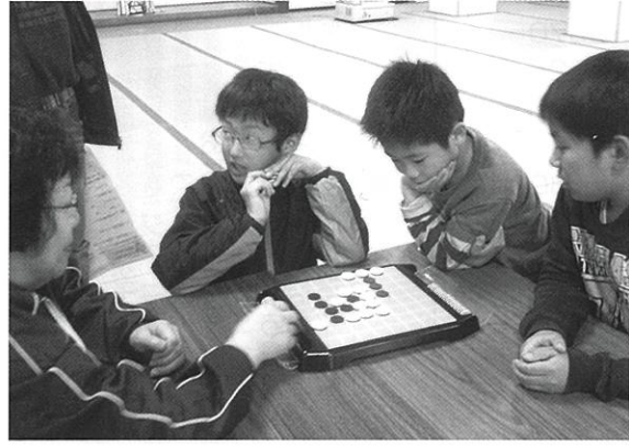
普段の放課後子ども教室の様子

「放課後子ども教室」は、地域の大人の協力のもと、子どもたちの成長を支える活動として、放課後の安全、安心な居場所を確保しながら、学習や様々な体験・交流の機会を提供するものです。鶴岡市では、コミュニティセンターや学校の余裕教室等を活用し、7つの小学校区で実施されています。