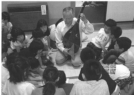
総合型文化モデル事業で、琵琶を体験

また、料理や手芸、工作をしたり、野外遊びや地域探検に出かけたりと、地域の方の特技や地域資源を活かした様々な体験活動を行っています。平成28年度からは、鶴岡市芸術文化協会の総合型文化クラブモデル事業として文化箏や詩吟、お茶などの芸術文化活動にも取り組んでいます。