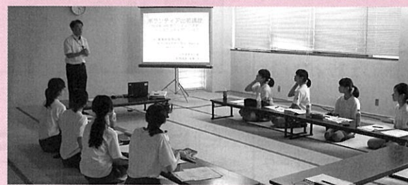
ボランティアについて学ぶ生徒たち

こんにちは、藤島地域の青少年ボランティアサークル Ben'sです。平成9年、旧藤島町の「声の広報」への協力をきっかけに結成されました。