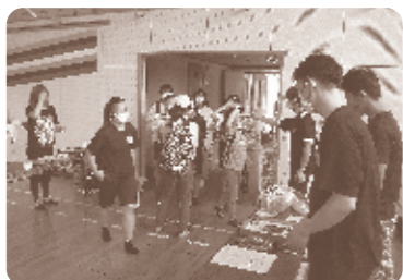
感染対策もバッチリ!