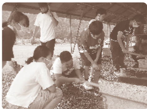
火加減はどうか?(野外炊飯)

8月1日(日)に大鳥自然の家、大鳥地内を会場に、日帰り自然体験イベント「とりキャン△2 in 大鳥自然の家」が開かれました。本イベントは、例年開催しているジュニアキャンプの代替事業として新しい生活様式に基づき、大鳥自然の家との共催で昨年度に引き続き実施したものです。