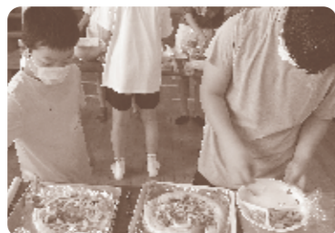
オリジナルピザ作り