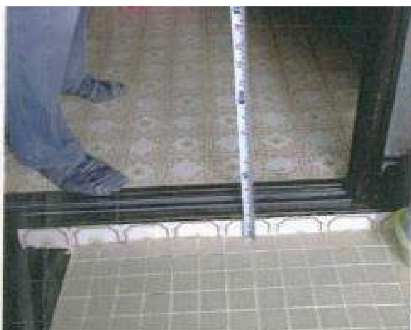
浴室段差写真 (段差5センチ)

(注意)要件工事以外でも見積書に記載されている工事 に関しては全ての着工前状況写真が必要です。