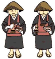
【托鉢するお坊さん】

・貧しい家庭の子ども達は、学校に弁当を持ってこることができませんでした。そこで、住職たちは何とかしようと雨の日も雪の日も休まず、托鉢(お経を唱えて町を歩き、お金や食べ物をいただくこと)を行い、弁当を持ってこれない子ども達に昼食を作りました。これが、日本の「学校給食」のはじまりです。