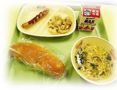
【東京五輪・パラリンピックのホストタウン献立】