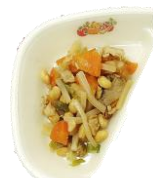
【大豆と豚肉の炒り煮】

・オール鶴岡産給食から「鶴岡いっぱいウィーク」に移行し、鶴岡産食材を多く取り入れた給食を実施する。