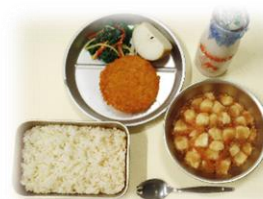
【昭和52年頃の給食】 食器:アルミ製