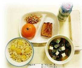
【平成9年頃の給食】 食器:ポリカーボネート製