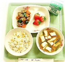
【平成14年頃の給食】 食器: PEN樹脂製