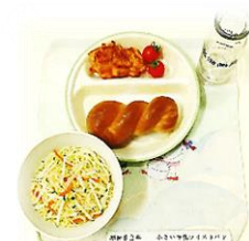
【昭和62年頃の給食】 食器:ポリプロピレン製