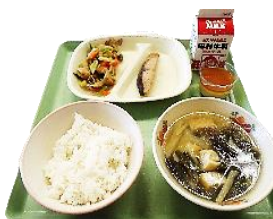
【食文化創造都市特別献立】

献立: ごはん(つや姫)、わらび汁、けんちん煮、鮭みそかす漬け焼き、ごま豆腐 ※その後、ごま豆腐から桜型の練り切りに替えて実施