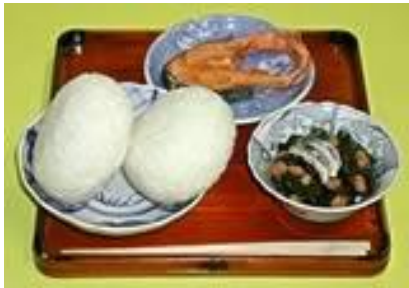
【発祥当時の給食:おにぎり、塩びき、煮びたしや漬物】