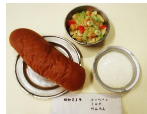
【昭和21年当時の給食】 食器:アルマイト製