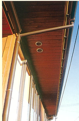
軒の張り出しを大きくして 外壁等を守る