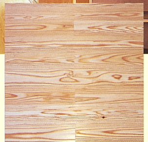
圧密化された杉のフローリング