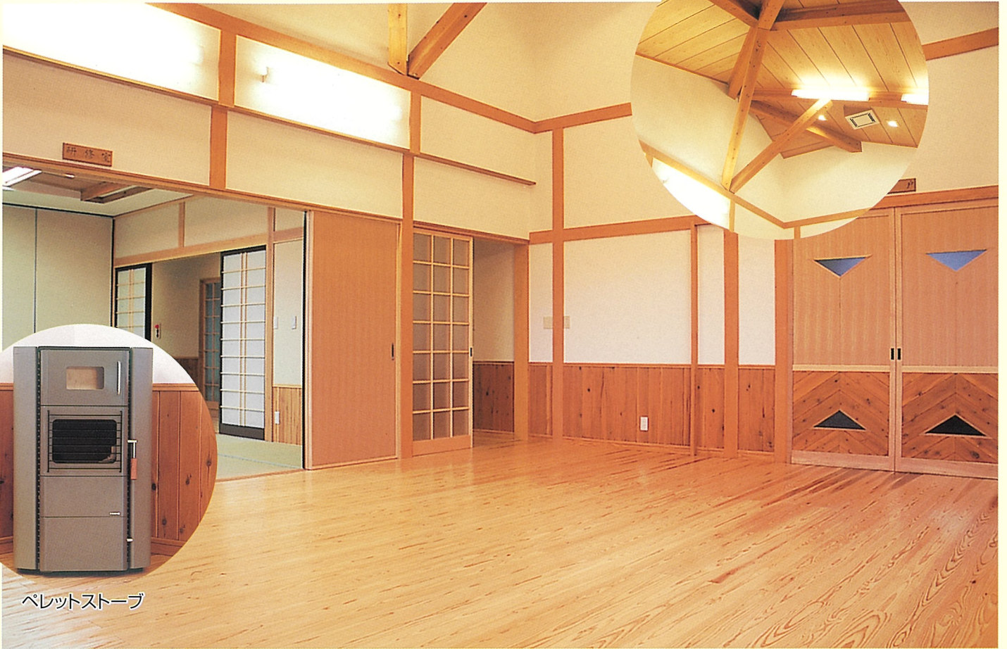
ペレットストーブ