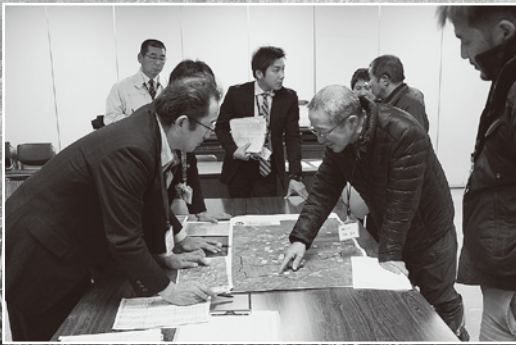
情報交換会の様子

分散した農地の解消を図りたいと考えている担い手のみなさん、 まずは農業委員会へご相談ください。