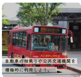
自動車の相乗りや公共交通機関を 積極的に利用しよう。