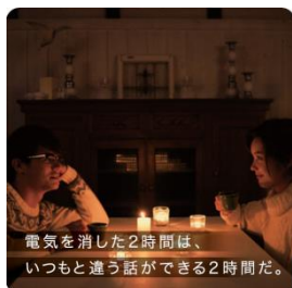
電気を消した2時間は、 いつもと違う話ができる2時間だ。

※3010運動とは、＜乾杯後30分＞は席を立たずに、＜お開き10分前＞は自分の席に戻って料理を楽しむ食品ロスを削減する取組です。