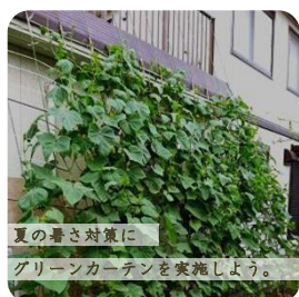
夏の暑さ対策に グリーンカーテンを実施しよう。