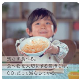
残さず食べる。 食べ物を大切にすることは、 CO 2 だって減らしている。