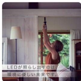
LEDが照らし出すのは、 環境に優しい未来です。

身近な生活のなかで、未来のために、いま選択できるアクションを選んで取り組んでいきましょう。