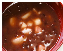
参加者にはヒシの実ぜんざいのふるまいがあります

開催場所 山形県鶴岡市馬町字駒繫3-1 自然学習交流館ほとりあ 学習交流室 参加費 寄附制（1人500円以上）