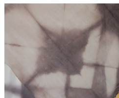
ヒシの実染め作品の展示もあります