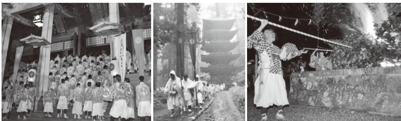
< 羽黒山 >

発展を願って、式典行事や海上歓迎・放流行事等が行われました。また、庄内地域各地で催された関連行事は、多くの人出でにぎわいました。