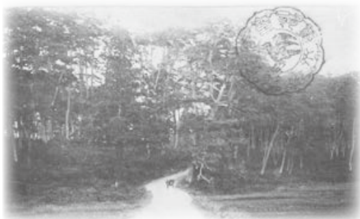
▲神路坂に広がる松林