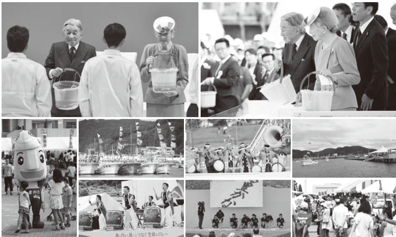
< 鼠ヶ関港、由良地区、酒田市、遊佐町 >