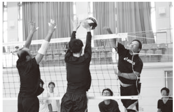
<鶴引スポーツセンター等>

水難救助員に任命されている地域の漁業者が、真剣な表情と機敏な動作で、海難事故を想定した訓練に取り組みました。