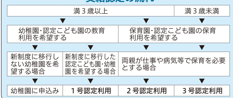
【1号認定者が利用できる施設】表1