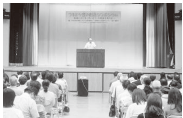
<藤島地区地域活動センター>

酒樽 だる のワインと月山ぶどうジュースが飲み放題。晴天の下、参加者はバーベキューを囲んで、楽しいひと時を過ごしました。