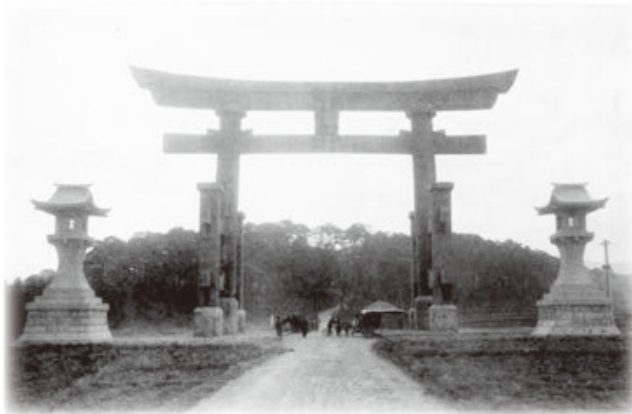
▲奉納当時の大鳥居