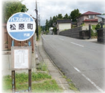
▲松原町バス停付近