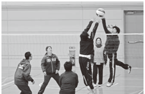
<櫛引スポーツセンター>

1.26 ~ 2.4 あつみ温泉に宿泊した台湾人観光客が雪遊びを体験。生まれて初めて雪に触れる人もいて、大人も子供も大喜びです。