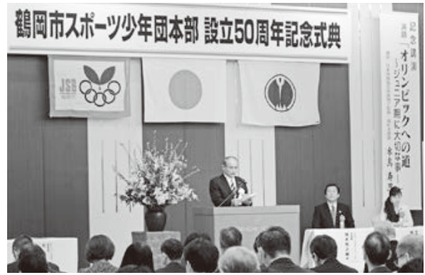
<東京第一ホテル鶴岡>

1.21 「気持ちいい！」中学生以下にリフトが無料開放されたこの日、子供たちはスキーや雪遊びを思う存分楽しみました。