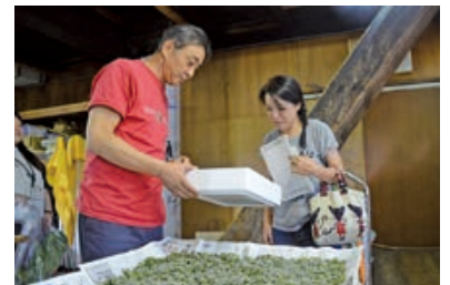
ふ化したばかりの蚕を受け取る繭人

本緞帳の素材の一部に用いる絹は、庄内地域で生産される「鶴岡シルク」です。その中には「繭人」が携わった絹も含まれます。繭人とは、市民が蚕の飼育体験をする取り組みで、鶴岡シルクタウン・プロジェクトの一環で始まりました。緞帳制作にあたり39人と9団体が繭人の取り組みに参加。松岡(株)の製糸工場で、繭を絹糸へ加工する過程を見学・体験した繭人は「大切に育てた蚕が本緞帳の一