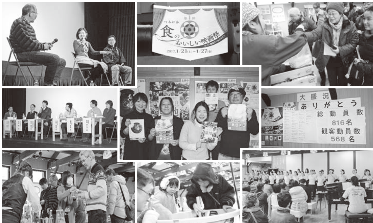
<鶴岡まちなかキネマ>