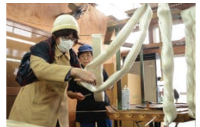
絹糸を束にする「捻造」を体験する繭人部になると思うとうれしい」「完成が楽しみです」と話していました。