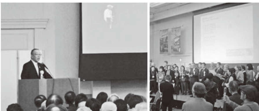
<タワーホール船堀（東京都江戸川区）>

2.12 競技はソフトバレー、ペタンク、カローリングの3種目。幅広い年代の約170人が参加し、爽やかな汗を流しました。