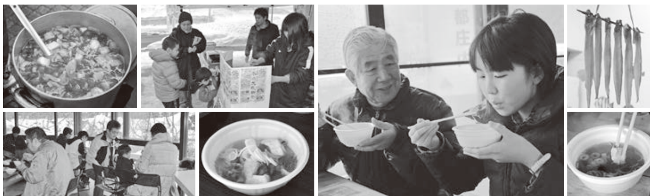
<月山あさひ博物館村、しゃりん>

クショーや日本酒カクテルの試飲、映画音楽の合唱、学校給食イベントなどが行われ、来場者は鶴岡食文化の魅力を変えて実感したようです。