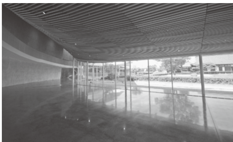
▲庄内藩校致道館を借景としたエントランスホール。地場産木材を使用したルーバー天井。ソファや椅子、机などを配置します。