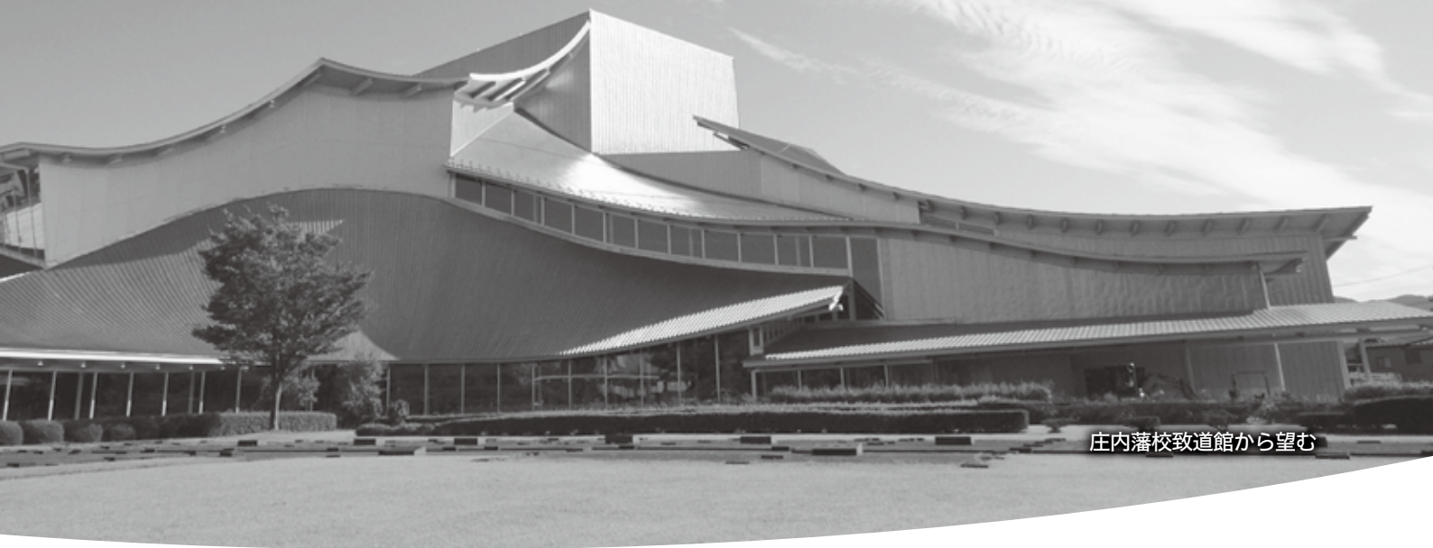
庄内藩校致道館から望む