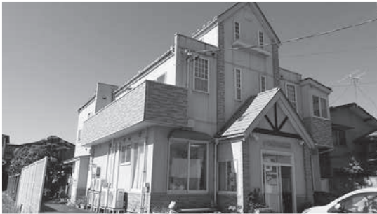
小池動物病院 朝暘第四小学校児童会