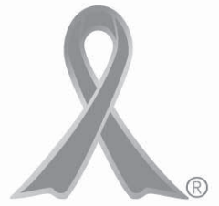
オレンジリボンには子供虐待を防止するというメッセージが込められています。

育てに悩んだら、また悩む親がいたら、すぐに連絡・相談してください。連絡者や内容に関する秘密は守られます。困ったときはまず相談を(連絡先)▽子ども家庭支援センター(にこふる)☎25・2741 ▽庄内児童相談所☎22・0790 ▽児童相談所全国共通3桁ダイヤル☎189