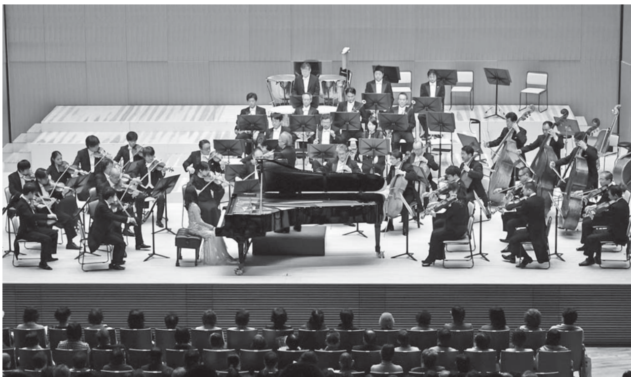
< 荘銀タクト鶴岡 >