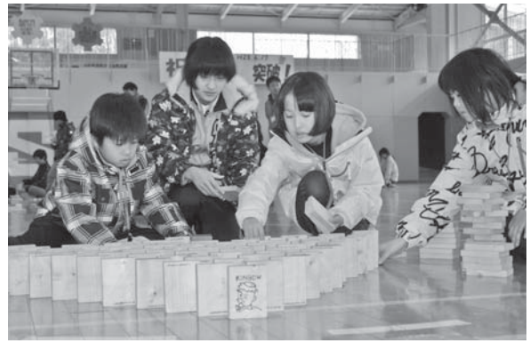
<金峰少年自然の家>

3.17 「大きいね〜!」。昨年10月に保護された幼獣。訪れた多くの観光客や家族連れに愛きょうのある姿を見せています。