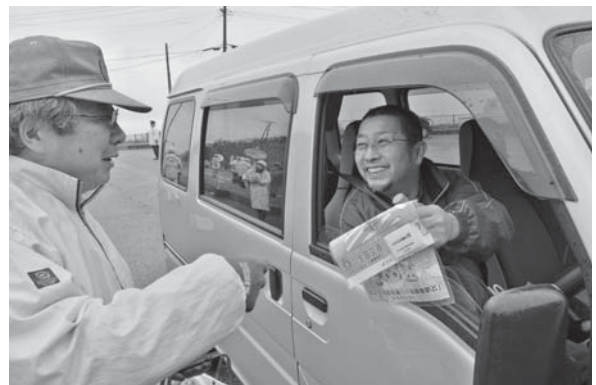
<県境広場(村上市・鶴岡市)>

3.27 ~30 友好都市・東京都新島村の児童42人が来鶴。羽黒地域の児童たちとスキーをしながら交流し、友好の絆を深めました。