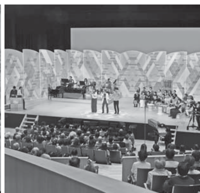
< 荘銀タクト鶴岡 >