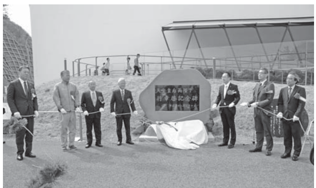
<松ヶ岡開墾場、加茂水族館>