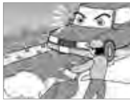
⑧道路への雪の排出はやめましょう（消雪道路も）