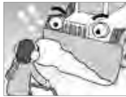
④危険！作業中は除雪車に近寄らないようにしましょう