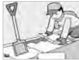
⑤雪捨てで側溝の蓋を外したら、必ず元どりに閉めましょう