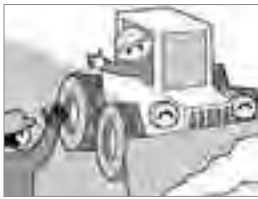
①除雪車にあつたら道を譲りましょう