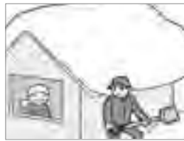
⑨高齢者・母子世帯等、除雪に困っている方には協力しましょう