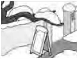
②道路にはみ出した枝や植木、看板等は撤去しましょう