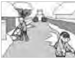
⑦除雪車通過後の雪の片付けはお互いに協力して行いましょう