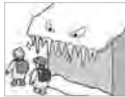
⑩屋根の雪や、道路に面したつらは早めにとりましょう