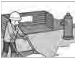
⑥消火栓、ごみステーション前の除雪は協力して行いましょう