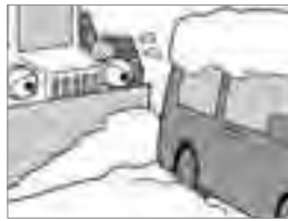
③除雪の妨げになる路上駐車は絶対にやめましょう