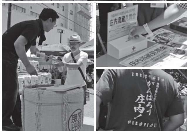
< J A全農山形鶴岡倉庫、マリカ西館周辺 >