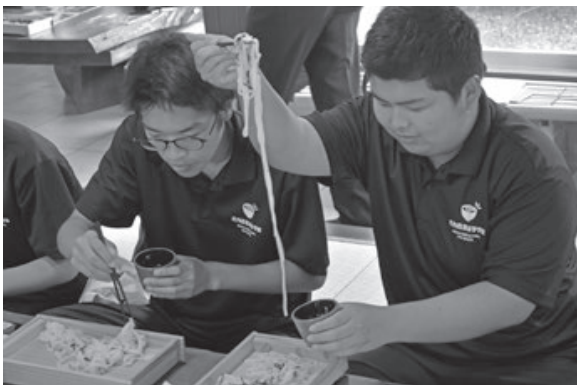
<日本そばと天ぷら草介>

外国クルーズ船の乗客を歓迎しようと開催。幻想的な雰囲気の中で奏でられるピアノの調べに、観客は魅了されました。