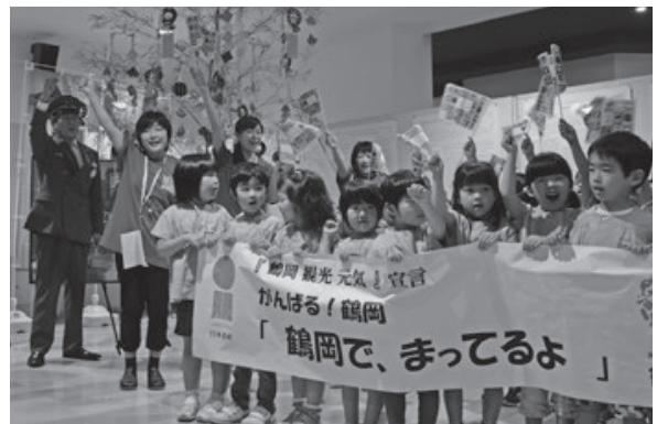
<つるおか食文化市場FOODEVER(フーデェヴァー)>

「ツルツルでうめ〜」。生徒たちは、授業で作ったうどんが使われた、地元飲食店の期間限定メニューを味わい大喜びでした。