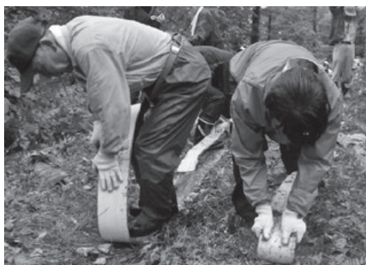
< 関川地内 >