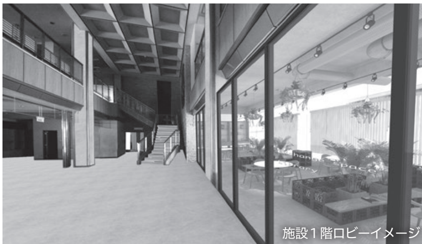
施設1階ロビーイメージ

研修生が心地よく農業を学び、ゆったり過ごすことができ、市民の研修・交流の場としても活用できる施設となるよう整備します。