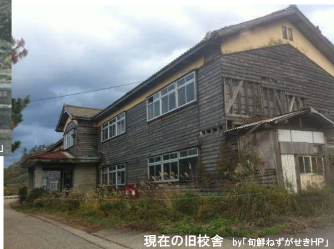
現在の旧校舎

統合から15年が経過し、既に体育館は解体され校舎のみが残されていましたが、老朽化が著しく、近隣の施設・住宅への影響も心配されることから解体が決定しました。長い間ありがとうございました。お疲れ様。