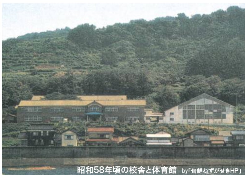
昭和58年頃の校舎と体育館

昭和28年に建設され、多くの人材を輩出してきた旧念珠関中学校校舎の解体工事が始まります。