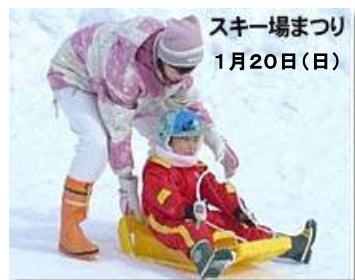
スキー場まつり 1月20日(日)