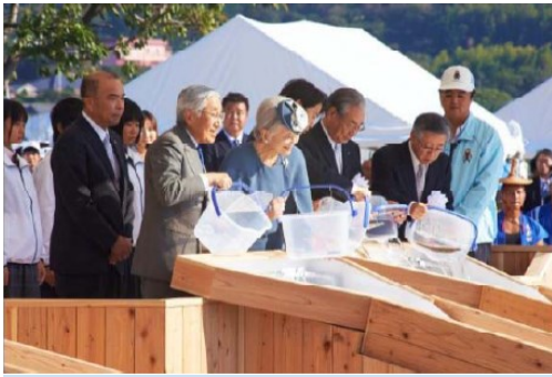
平成25年熊本県 天皇皇后両陛下による御放流の御様子

水産業の振興と水産資源の維持、海や湖沼・河川的环境保全の大切さを広く国民に訴えることを目的として、「全国豊かな海づくり大会」第36回大会が、平成28年に山形県で開催されることが決定しました。大会のうち、海上歓迎・放流行事が鼠ヶ関港で行われます。