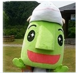
マスコットキャラクター 「もっけだのん」