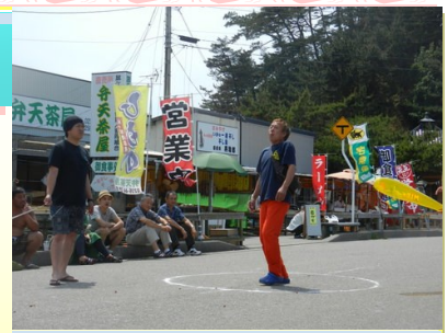
イカのトンビ飛ばし世界大会

これから夏本番を迎える鼠ヶ関では、7月11日～漁船クルージング運行開始、7月17日～海開き、7月19日には第30回温海トライアスロン大会が行われます。また、あつみ温泉ではばら園まつりは終了しましたが、10月頃まで次々に咲かせるばらの花をお楽しみいただけますし、8月8日には夏のイベントとして定着した「せせらぎの能」の他、夏のイベントがたくさん開催されますので、今年の夏は是非ふるさと温海でゆっくりお楽しみください。