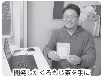
開発したくろもじ茶を手に

温海地域は海と山で文化や風土も異なり、それぞれを知るだけでも大変面白く感じています。今後も地域の方々と交流をしながら、温海川の一住民として、自然と共存して生活していきたいと思っています。