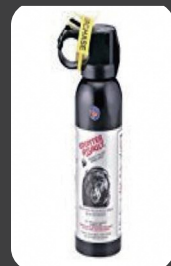
クマ撃退スプレー