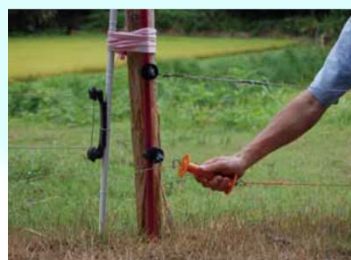
侵入防止柵の設置