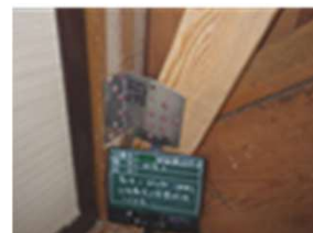
筋かい金物設置例