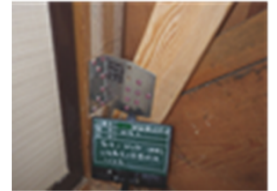
筋かい金物設置例