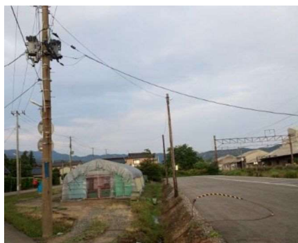
配電設備の設被状況（支線断線，引込線外れ）