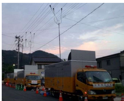
高圧応急電源車の設置状況(鶴岡市湯温海湯之里)