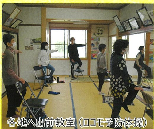
各地へ出前教室 (ロコモ予防体操)