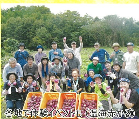
各地で体験イベントも (温海赤かぶ)