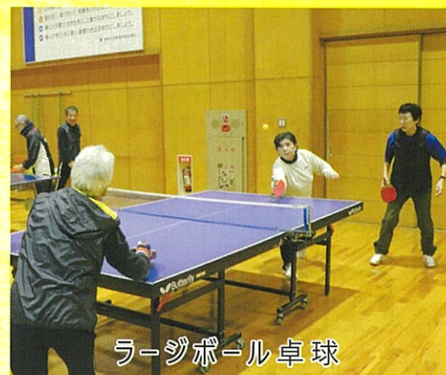
ラージボール卓球