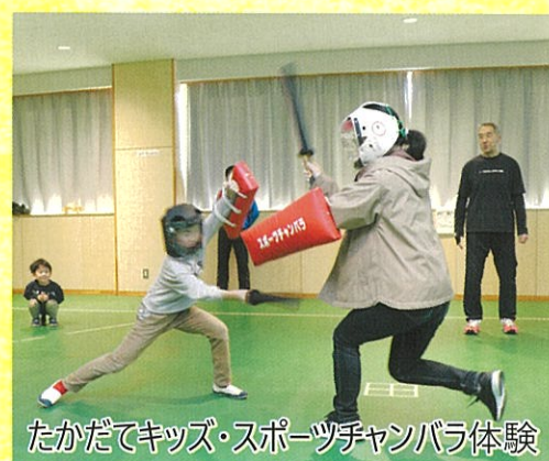
たかだてキッズ・スポーツチャンバラ体験