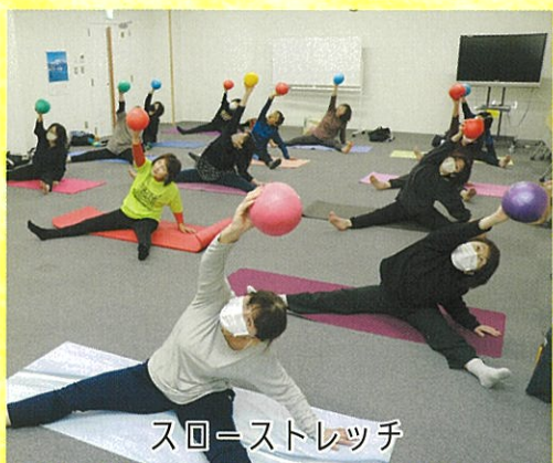
スローストレッチ