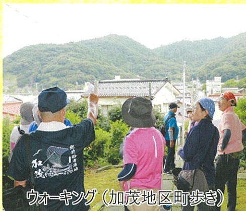
ウォーキング (加茂地区町歩き)