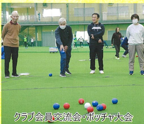
クラブ会員交流会・ボッチャ大会