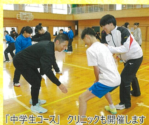
「中学生コース」クリニックも開催します