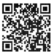
鶴岡市 LINE 公式アカウント

Step1 左の QR コードより 鶴岡市 LINE 公式 アカウントを友だち登録