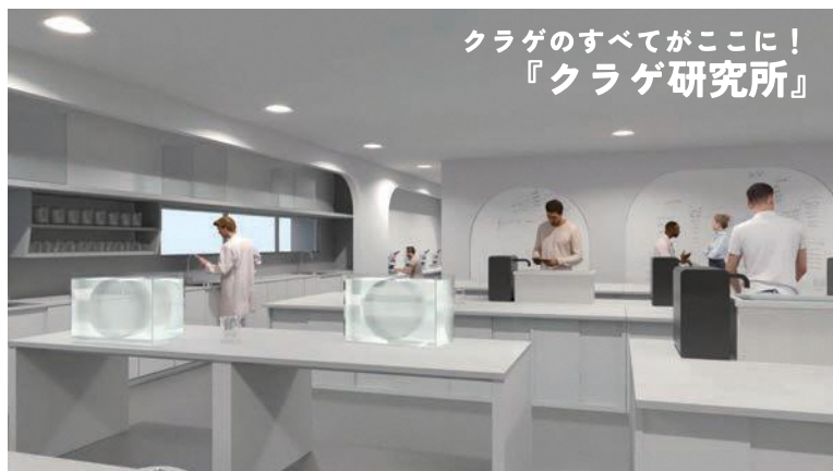
クラゲのすべてがここに！ 『クラゲ研究所』

令和12年には、前身である山形県水族館開館から100年を迎えます。皆様にご愛される施設を目指し、これまでも、これからも、生涯学習・調査研究の拠点として、地域とつながる交流拠点として、鶴岡市立加茂水族館はその歩みを続けていきます。