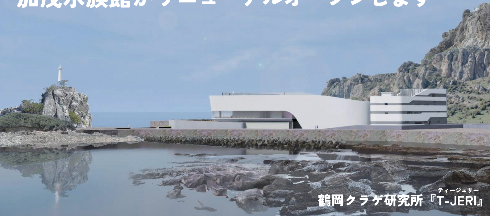
ティージェリー 鶴岡クラゲ研究所『T-JERI』

日本海を望む海岸にたたずむ小さな鶴岡市立加茂水族館は、今から約30年前である平成9年にクラゲの展示を始め、そこから大きく世界へ羽ばたいていきました。水槽にキラキラとゆらめくクラゲたちの美しさ、神秘的な姿に多くの来館者が魅了され、加茂水族館を応援してくれるようになっていきます。