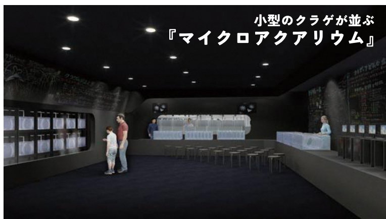
小型のクラゲが並ぶ 『マイクロアクアリウム』