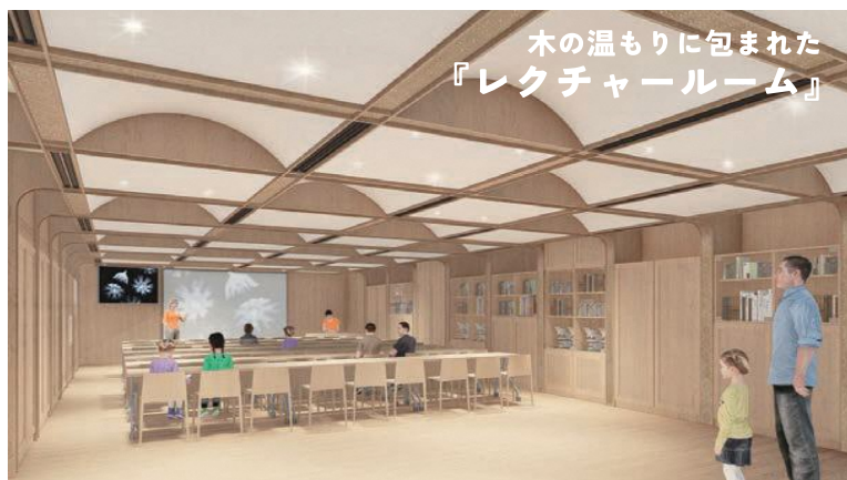
木の温もりに包まれた 『レクチャールーム』