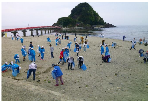
昨年のクリーン作戦の様子

海岸のごみを拾いながら、世界的な課題となっている海洋プラスチックごみ問題を考えてみませんか？