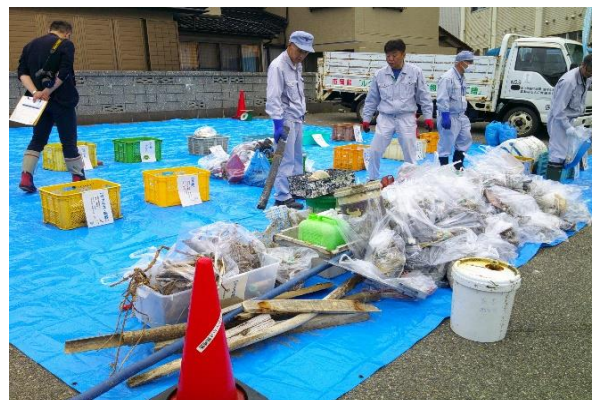
昨年回収したごみ