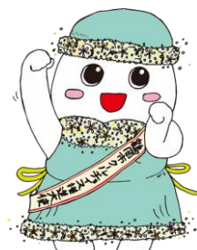
鶴岡市エコキャラ 「みどりちゃん」