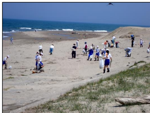
昨年のクリーン作戦の様子

海岸のごみを拾いながら、世界的な課題となっている海洋プラスチックごみ問題を考えてみませんか？