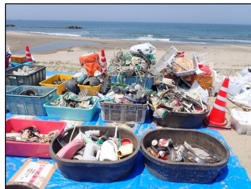
昨年回収したごみ