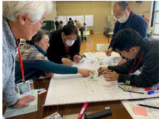
班ごとに熱心なグループワークが行われました。