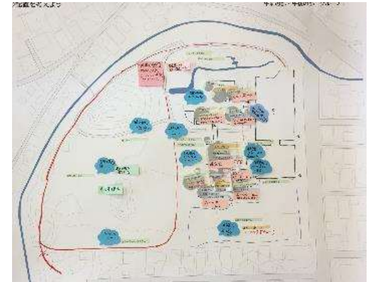
参加者の意見、アイデアがぎっしりとつまったワークシートが出来上がりました。