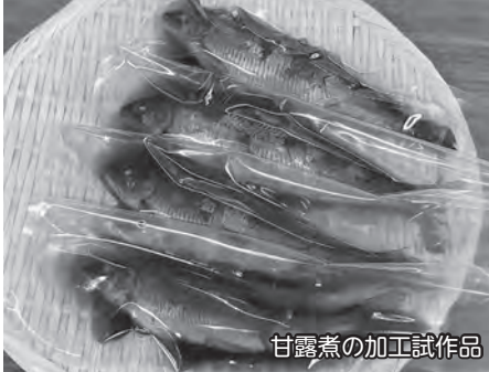
甘露煮の加工試作品