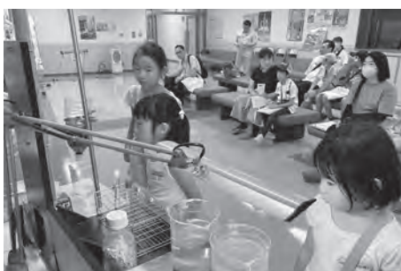
ろ過実験装置に興味津々(朝日浄水場)

8月5日、親子で参加する水道施設見学イベントを開催しました。猛暑の中、7組16名から参加いただき、バスで月山ダム⇒朝日浄水場⇒高坂配水地を巡った後、水の飲み比べを行いました。