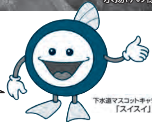
下水道マスコットキャラクター 「スイスイ」

下水をきれいにした処理水に含まれる栄養分を活用して育てた藻を与え、 養殖した鮎の愛称を募集し『つるおかBISTRO鮎』と決定しました!