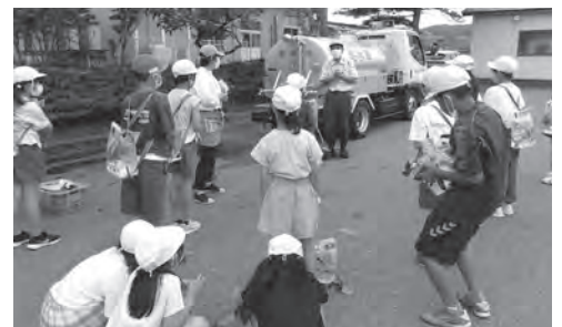
背負った方が軽く感じるね

後日、「水を大切に使いたい」「一人が一日で使う水の量に驚いた」などの感想が書かれた手紙をいただきました。