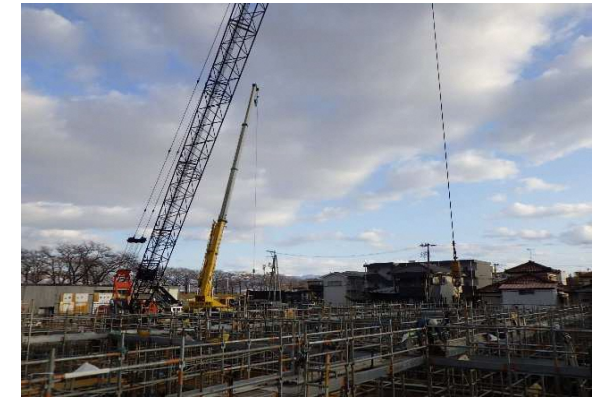
クレーン作業状況