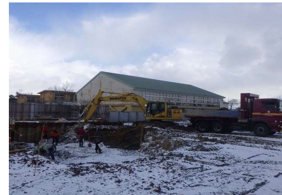
A棟土工事掘削状況