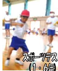
スポーツフェス (1・6年)