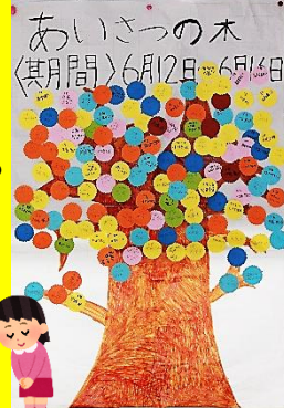
あいさつの木 (其月間)6月2日~6月8日

児童会の運営委員と各学年の代表委員の皆さんが中心になって「あいさつ運動」に取り組みました。これからも『あいさつの木』がどんどん枝を伸ばし、たくさんの葉をつけ、きれいな花を咲かせることを楽しみにしています。