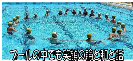
プールの中でも笑顔の輪と和と話

早いもので、1学期も残すところ1ヶ月となりました。1日1日をより大切にしながら、褒め・認め・励ましの言葉かけを積極的にいき、子ども達が確かな成長を実感しながら夏休みを迎えることができるよう、指導・支援に努めてまいります。7月もお世話になります。よろしくお願いいたします。