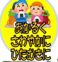
あかるく さわやかに ひたむきに