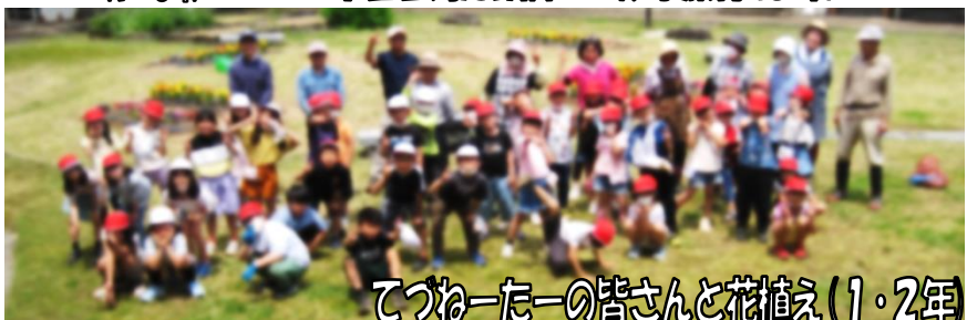
てづね一たーの皆さんと花植え(1・2年)

ありがとうございました 株式会社アサヒニズマ様 より今年度も多大なご寄付を 頂戴いたしました。