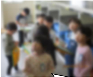
【1年】学校探検 配膳室にエレベーターがある！