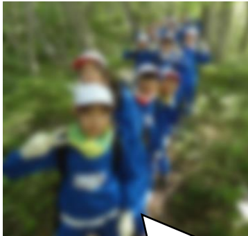
【5年】自然教室 励まし合って山頂へ