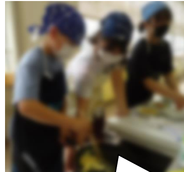
【6年】調理実習 炒める調理にチャレンジ!