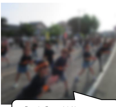
【4年】天神祭 笑顔のサンサンキッズ