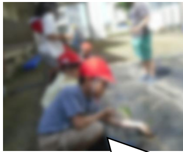
【2年】生活科の学習 大きく育て さつまいも