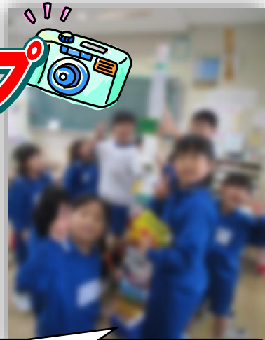
【1年】 どんなリースにしようかな？