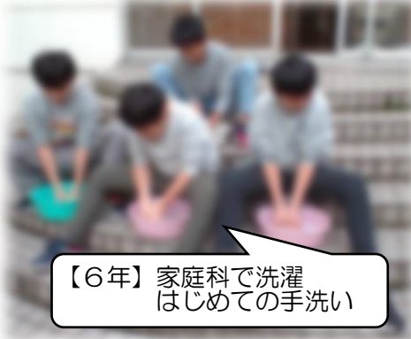
【6年】家庭科で洗濯 はじめての手洗い