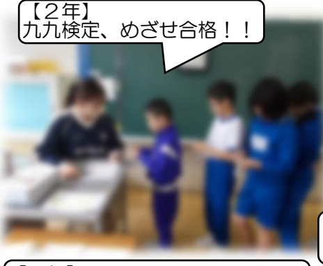
【2年】 九九検定、めざせ合格！！