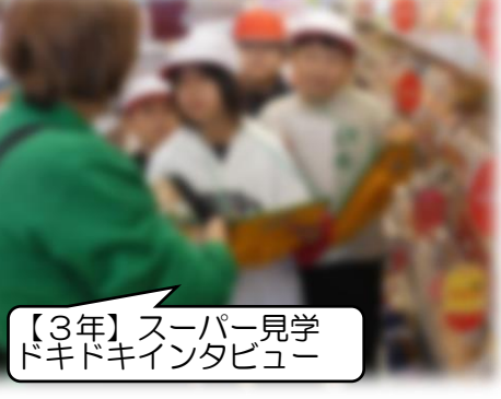
【3年】スーパー見学 ドキドキインタビュー