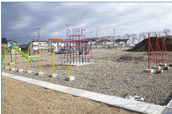
現在のグラウンド工事の様子