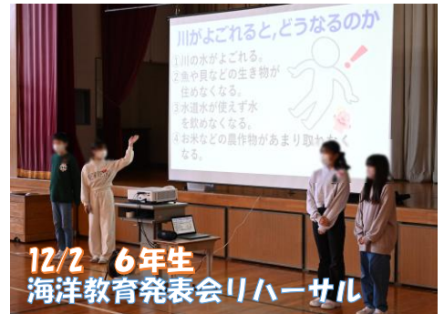
12/2 6年生 海洋教育発表会リハーサル

今回の経験は、子どもたちにとって学びのゴールであると同時に、私たち教職員にとっても、教える中心から 子どもにゆだねる授業 への転換を進める大きな後押しとなりました。