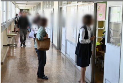
5/15(金)児童引き渡し訓練

羽黒山は午年御縁年を迎え、今後多くの参拝客が訪れることが予想されます。今回の清掃で、訪れる方々が気持ちよく過ごせるよう、少しでもお役に立てたのではないかと思います。ふるさと「羽黒」を大切にすることを育む、貴重な機会となりました。