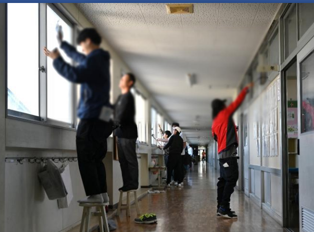
5/16(土)PTA環境整備作業 教室がとっても明るくなりました