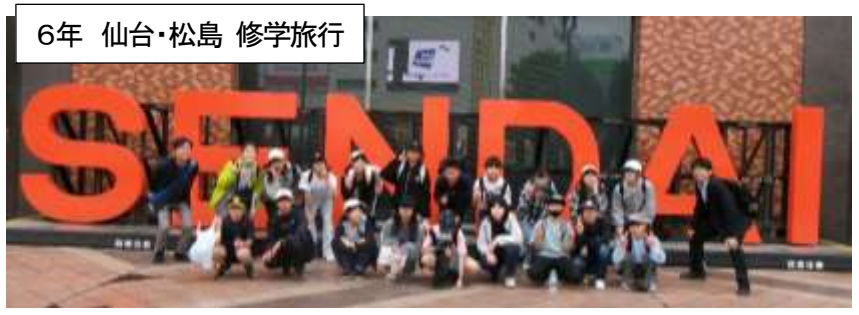
6年 仙台・松島 修学旅行