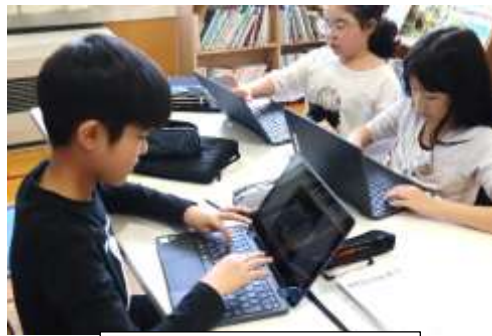
4年 クラブ活動 始まる