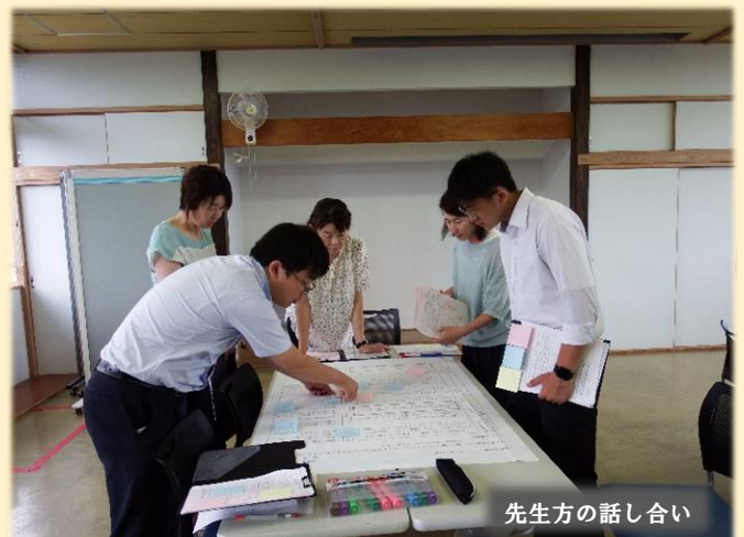
先生方の話し合い