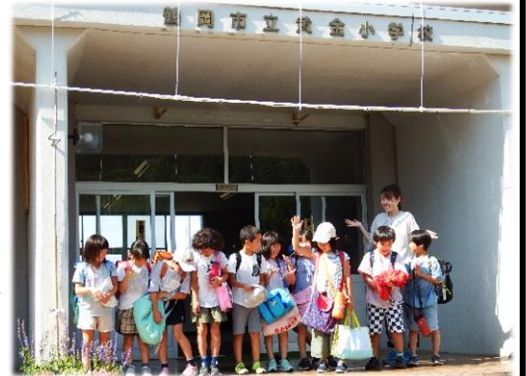
ミストを浴びる子ども達

最後に、保護者・地域の皆様、1学期間の学校教育活動へのご理解とご協力に感謝申し上げます。今年は最高気温の記録が更新され、気候科学者によると観測史上最も暑い年になる可能性があるとのことです。体調管理にご留意なさり、2学期以降も67人の“黄金っ子”たちをよろしくお願いいたします。