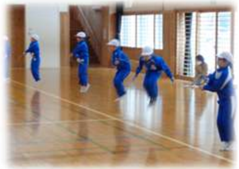
練習の成果を披露したなわとび発表会

12月から2月にかけて、全校で体力向上をめざして「なわとび運動」に取り組んでいる。体育の時間だけでなく、中間休みに全校で練習に取り組んだり、休み時間に技の習得や向上をめざしたりして自主的に練習する様子もあった。校内の感染状況により、2月16日に延期した「なわとび発表会」では、自分の目標に向かって練習してきた成果を存分に発揮することができた。