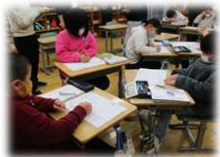
グループでよりよい考えを導き出す