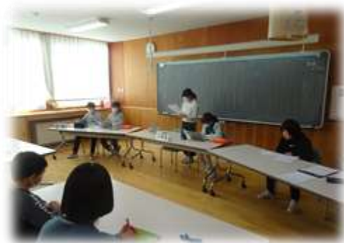
「6年生を送る会」についての代表委員会