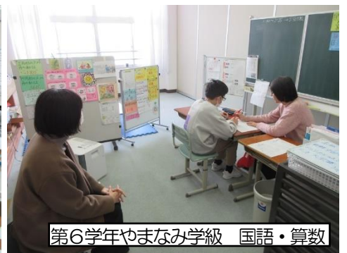
第6学年やまなみ学級 国語・算数