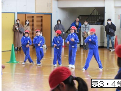
第3・4学年 体育 参観の保護者ともハイタッチ!