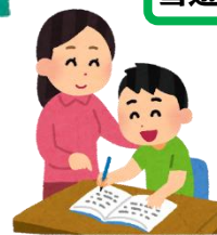
授業（見守り・補助）