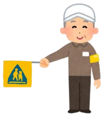
スクールガード （登下校の見守り）