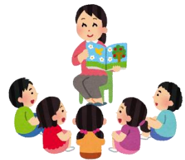
読も～の（読み聞かせ）