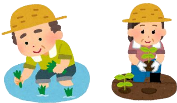
しっこ農園・しっこ田

東栄小学校では、保護者・地域と学校が連携して、子ども達の学習活動や学習環境をよりよいものにしていくために、『学校支援ボランティア』を募集しています。子ども達のために、ぜひ、保護者の皆様、地域の皆様のお力をお貸しください！