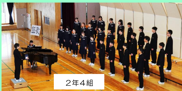
2 年 4 組