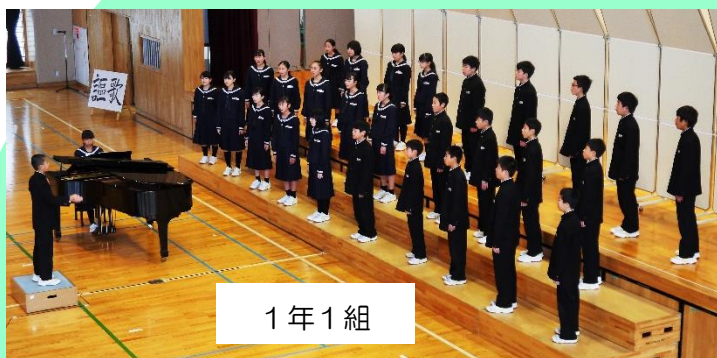
1 年 1 組