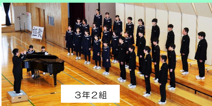
3 年 2 組

フロアには、全校生徒が間隔を取って座り、演奏を聞きました。かがやき学級のトーンチャイムの演奏から始まり、1・2年生は課題曲を、3年生は自由曲を披露しました。どの学級も短期間の練習でしたが、仕上がりの良い合唱になりました。