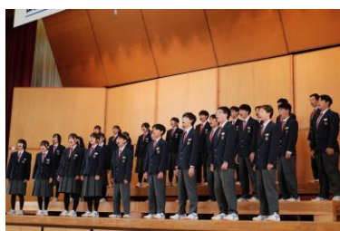
★ 最優秀賞 1組 証