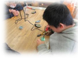
技術; 基盤に電子部品をつけてみよう