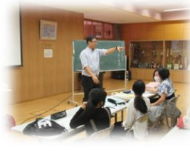
国語; 五中の校歌の秘密を探ろう