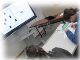
数学; パズルで考える力を伸ばそう

湯野浜・大山・西郷小学校 3 校の 6 年生合わせて 81 名が来校しました。中学校の授業を体験することはもちろん、違う小学校の人と一緒に学習しながら、笑顔で関わる場面が多くみられました。