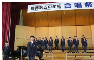
★ 最優秀賞 2組 空は今