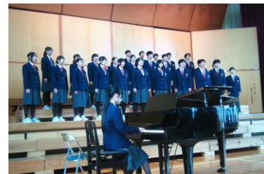
★ 最優秀賞 3組 時の旅人