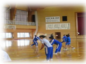
体育; Let's enjoy バレーボール