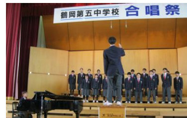
3組 永遠のキャンバス