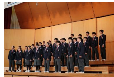
3組 Cantare ～歌よ大地に～

合唱は、学年・学級みんなが呼吸を合わせること、それぞれのパートの役割をこなすこと、互いの歌声を合わせることが大切です。ステージ発表を迎えるまでには、苦悩の日々があったこととされますが、それを乗り越えた歌声は、五中らしい堂々とした合唱でした。これからも、築き上げた絆を日々の生活に生かし、みんながエースであり、一人ひとりが主役になることのできる五中を創っていきましょう。多くの保護者・地域の方よりご来場いただきました。ありがとうございました。