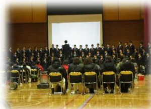
歓迎合唱(1学年)のようす

歓迎合唱では、1年生が、合唱の五中にふさわしい歌声を披露し、歓迎の気持ちを表現しました。寒い体育館の中での説明会でしたが、真剣なまなざしで話を聞くことのできる6年生でした。新しい生活への思い新たに入学してくれることを、1・2年生と教職員一同、楽しみにしています。元気な心と身体、大きな夢と希望をもって入学式に臨んでほしいと願っています。