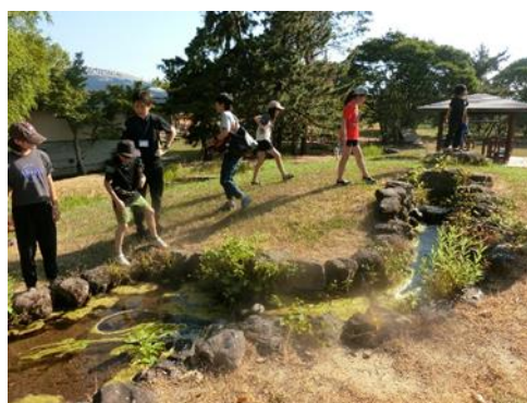
鶴岡市中央児童館野外