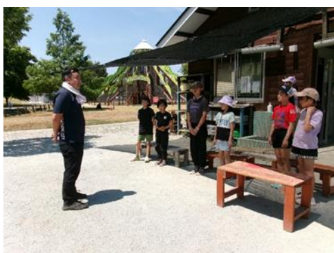
東根市 あそびあランド