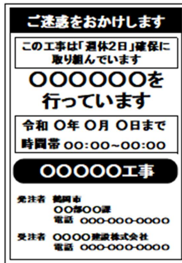
—(図)— 工事標示板への明示の例