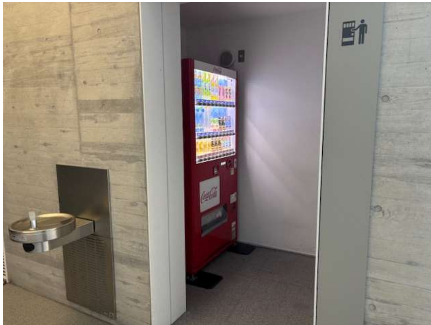
鶴岡アートフォーラム 1階 交流広場階段下